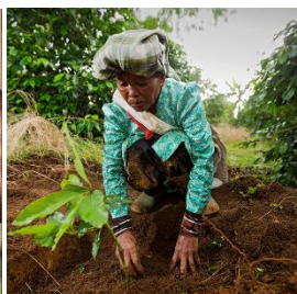
Kopi Lestari Indonésie