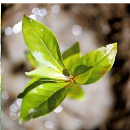
Pur Hexagone France

Depuis 2009, AccorHotels soutient les communautés locales et les petits producteurs à travers Plant For the Planet . Avec l'aide de son partenaire Pur Projet , le Groupe s'est engagé à planter des arbres en bordure ou au cœur de surfaces cultivées ou de pâturages, dans une démarche de préservation et de régénération des écosystèmes. L'ambition est de favoriser la transition vers une agriculture plus écologique et de compenser les impacts sur l'eau et la biodiversité engendrés lors de la phase de production agricole des aliments consommés dans les hôtels.