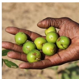
SOS Sahel Sénégal

Pour accéder à la plateforme de financement et en savoir plus sur chaque projet de plantation, cliquez ci-dessous :