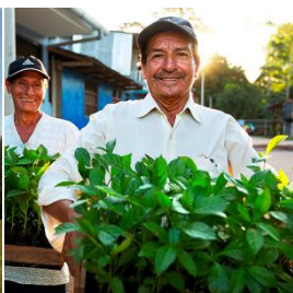
Alto Huayabamba Pérou