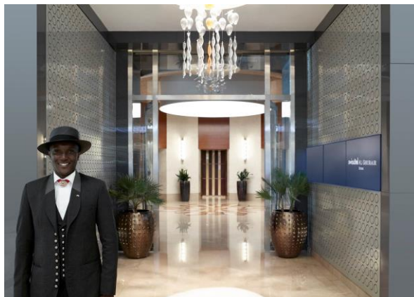
Entrée, Swissôtel Al Ghurair

Al Ghurair annonce le lancement de la marque Swissôtel à Dubaï avec l'ouverture du Swissôtel Al Ghurair