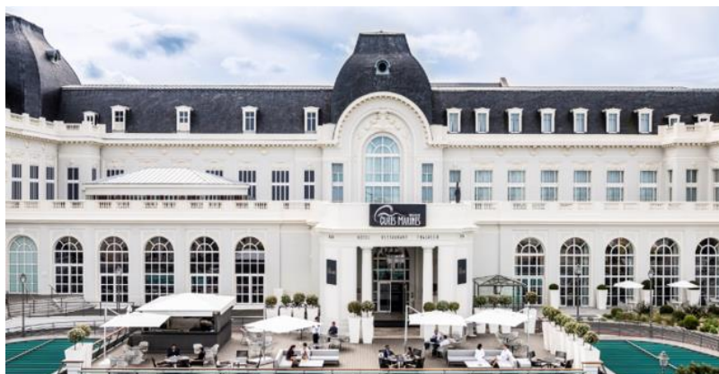
Cures Marines de Trouville Hotel & Spa

Pour 4 journées de soins et 4 nuits en chambre double classique et en demi-pension, en basse saison, hors promotion