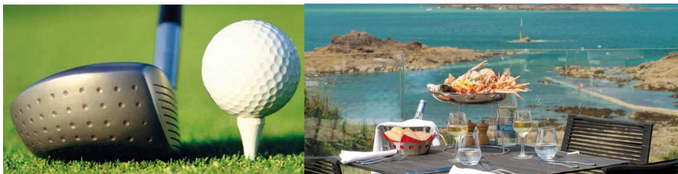
Novotel Thalassa Dinard

Côté golf , les amateurs peuvent tester 4 greens fees sur les parcours de leur choix ou réaliser un stage de 8h au golf de Trémereux (initiation, perfectionnement ou carte verte). La Nouveauté ? Un practice de golf face à la mer et des ateliers d'entraînement (bunker, green d'entraînement sur place 7 trous, shipping).